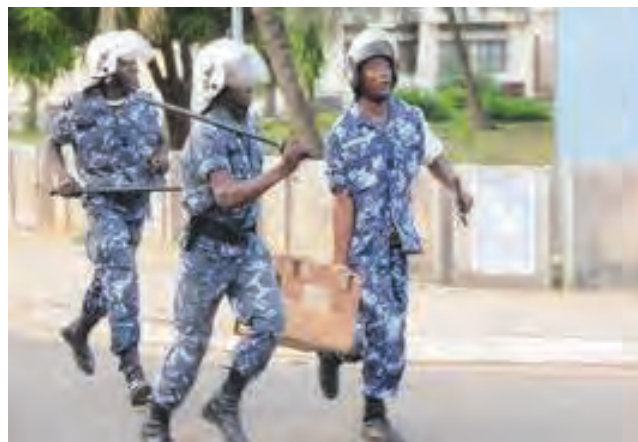
Les forces de l'ordre avec les urnes en 2005

Le 3 mai 2005, c'est sans surprise que Faure Gnassingbé est proclamé président de la République par la Cour constitutionnelle avec 60,15 % des voix 27 et, malgré les conditions douteuses et contraires au droit, celui-ci est reconnu par la CEDEAO. Des voix se sont élevées aussitôt contre l'élection de Faure Gnassingbé. Dans la foulée, BOB AKITANI s'auto-proclame président de la République pendant que des heurts et des violences continuent d'être perpétrés partout au Togo.