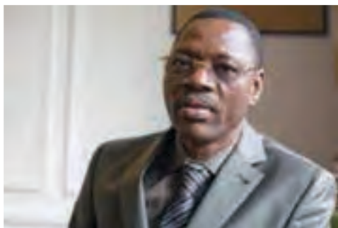
L'ex Président de la CNDH, Koffi Kounté en exil en France

La CNDH, créée en 1987, a été mise en conformité avec les Principes de Paris en 2005 : garanties d'indépendance ; possibilité de s'autosaisir et d'enquêter sur toutes les formes de violations des droits de l'homme commises sur le territoire togolais ; possibilité pour toute personne ou organisation non gouvernementale de saisir la commission.