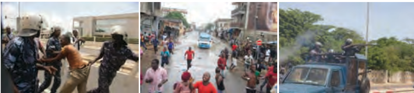
Répression des manifestants de l'ANC à Lomé

Seule l'ANC semble faire actuellement l'objet, au Togo, d'une politique de harcèlement continu de la part du pouvoir en place : intimidations et menaces contre des personnes impliquées dans des manifestations/rassemblements de l'ANC dans le Nord du pays ; répression de manifestations à Lomé, par des milices proches de l'UNIR et harcèlement judiciaire des principaux dirigeants de l'ANC dans l'Affaire des incendies de Kara et de Lomé (janvier 2013).