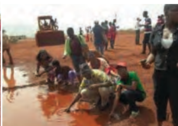
L'eau impure de Bangeli