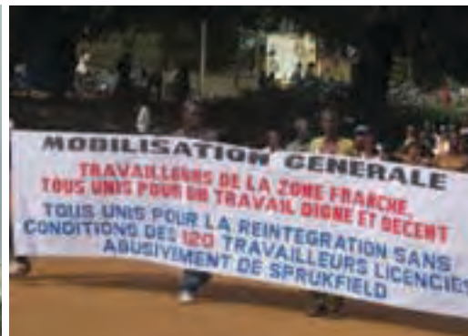
Une mobilisation sociale des travailleurs dans la zone Franche

Mining d'exploitation de Fer à Bandjéli, celui des enseignants des Ecoles privées laïques et confessionnelles, celui des travailleurs de certaines entreprises de la Zone Franche, notamment celle de fabrication de produits pharmaceutiques (Sprukfield), et d'autres encore, comme WACEM, la Générale Industrie du Togo, INDUPLAST etc