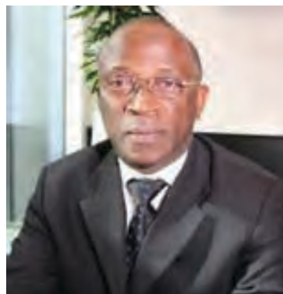
Me APEVON Président du CAR

Pour le CAR, « il y a un vrai problème de confiance entre gouvernés et gouvernants. Les Togolais ont le sentiment de ne pas être égaux devant les biens publics de l'Etat. En terme de réconciliation, les Togolais ne voient pas de changements de comportement des dirigeants ». Et d'ajouter : « il y a une désillusion du public et des cadres/forces vives envers le politique, lorsque ceux-ci se sont rendus compte qu'on passait d'une course de vitesse à une course de fond (...) Les cadres sont usés/découragés et la jeunesse ne se mobilise pas et n'a pas la volonté de se sacrifier comme leurs aînés qui vivent dans la pauvreté. Les élites ne vont plus vers les partis politiques ».