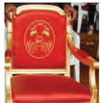
Le Fauteuil présidentiel

Globalement, on peut conclure que le Togo a rompu, depuis les événements malheureux de 2005, avec les violences